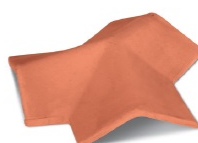
Trevie Three-Way Tile Codice/code TRS---