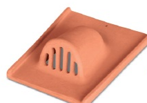
Aeratore Ventilation Tile Codice/code ABE---