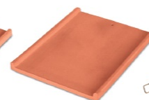
Gronda Gutter line First Tile Codice/code GRO---