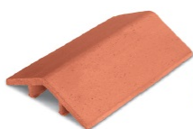
Sellone Ridge Tile Codice/code SEL---