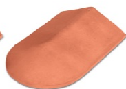
Finale End Ridge Tile Codice/code FIS---